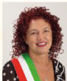
ORNELLA LEONARDI SINDACO COMUNE DI GAZZO